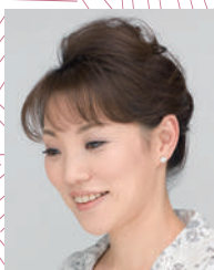
池坊 専好 華道家元池坊 次期家元