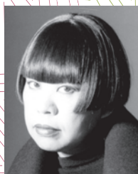
コシノジュンコ デザイナー